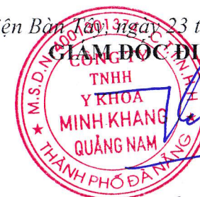
HỒ XUÂN THÀNH

Giờ làm việc của Bệnh viện: Từ thứ 2 đến thứ 7 hàng tuần đối với hành chánh: từ 6h30-17h00